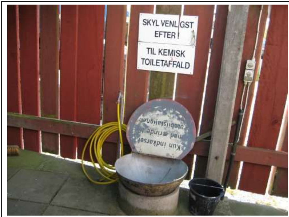
Udslagskumme til tømning af kemiske toiletter.