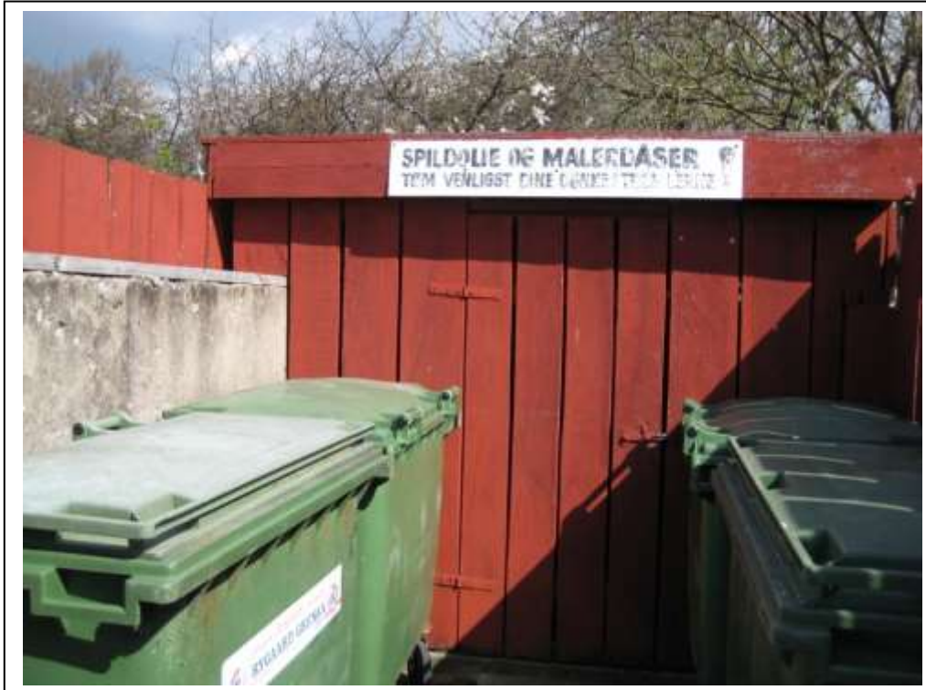
Skur til olie- og kemikaleaffald

Plan for affaldsmodtagelse og håndtering – 2021