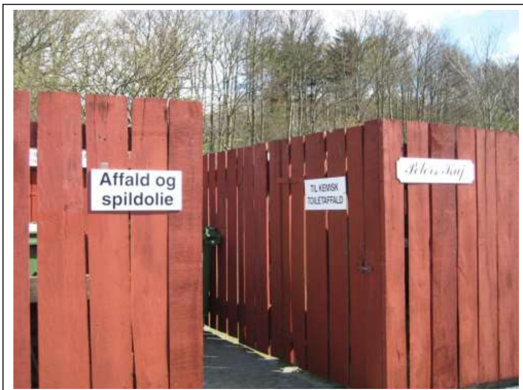
Indgang til affaldsgård